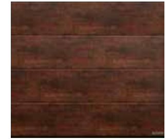
12 Rusty Steel