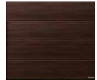
30 Walnuss Terra (Valnød Terra)