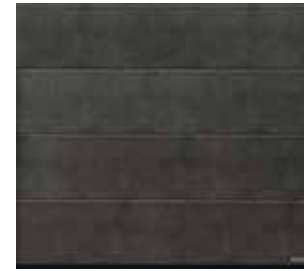
10 Grigio scuro